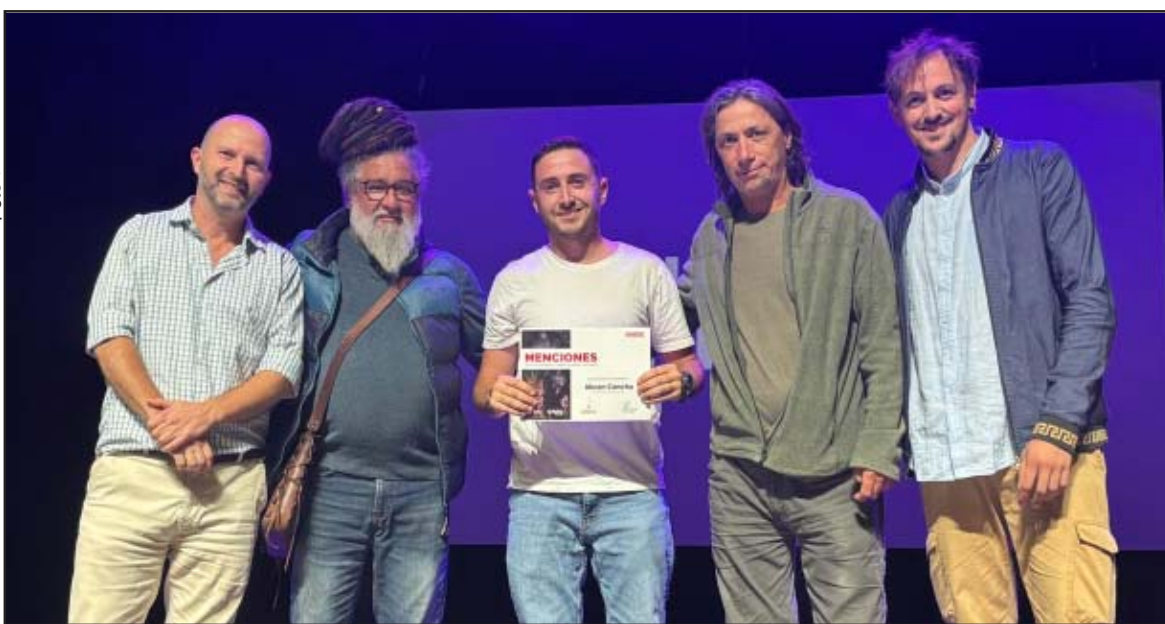
Representante de Abran Cancha - Comparsa pandense recibiendo su reconocimiento.

dinámica de premiación fue ágil pero muy emotiva. El maestro de ceremonias fue el encargado de anunciar a los ganadores, que se hicieron presentes en el escenario a medida que iban mencionando cada premio, donde los esperaban autoridades, miembros del jurado y personas vinculadas al Carnaval para entregarles un reconocimiento.